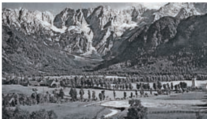
Vabljeni na pohodniški festival!

Celotna vsebina programov je za udeležence brezplačna. Dodatne informacije in rezervacije uredite na: TIC Jezersko, +386 51 219 282 ali tic@jezersko.si .