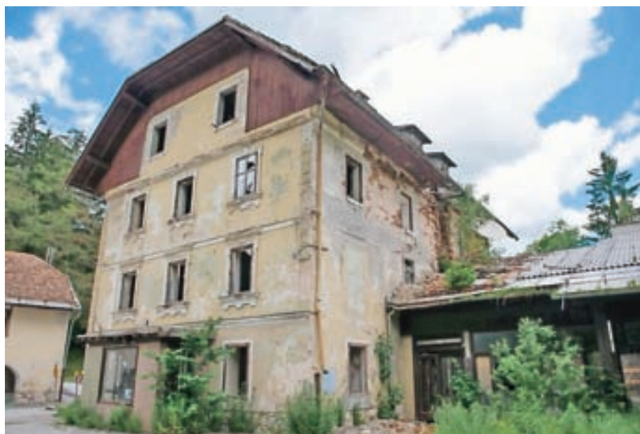
Čakajo na rušenje propadajoče Kazine.

Hotel Kazina na Jezerskem, ena nekdanj najmarkantnejših stavb v kraju, je zaprt dve desetletji. Pred dobrim desetletjem ga je od lastnika, ki ga je dobil vrnjenega v denacionalizacijskem postopku, kupilo ljubljansko podjetje Altus Consulting s ciljem, da ga preuredijo v hotel s štiriimi zvezdicami in 70 posteljami. Iz teh načrtov še vedno ni nič, objekt propada in ni le sramota za Jezersko, pač pa je tudi nevaren, zaradi česar so na zahtevo občine že pred časom zožili regionalno cesto, da se ne bi kaj zrušilo na mimovozeče avtomobile ali celo na pešce, ki hodijo mimo stavbe. Lastnik objekta je lani dobil dovoljenje za rušenje, ki pa se vse doslej ni zgodilo. Jezerjani pa še naprej pričakujejo, da bodo propadajočo stavbo porušili, da vsaj ne bo več nevarnosti za prebivalce in obiskovalce, če že ne morejo dočakati novega hotela, ki bi kraju vrnil nekdanji turistični sijaj.