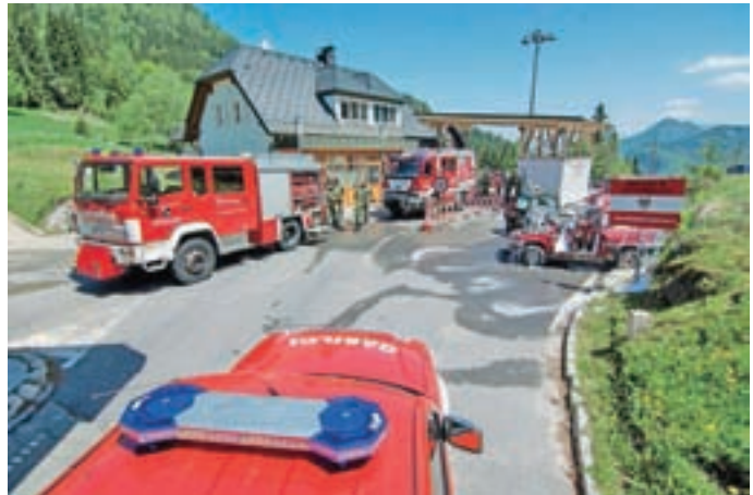
Mednarodna gasilska vaja je potekala na mejnem prehodu Jezerski vrh.