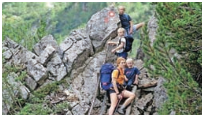
Pravljični pohod do Češke kočice