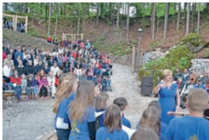
Odlično obiskan otvoritveni koncert Vox Laci