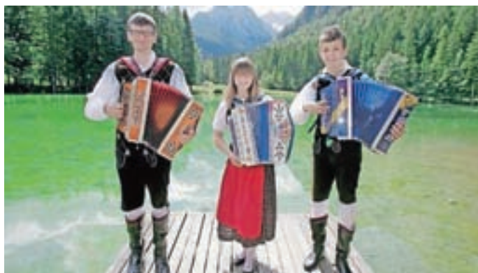
Naj harmonika zapoje