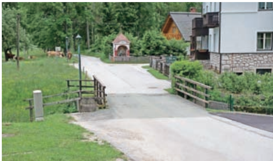
V kratkem se bo začela obnova mostu pri Tonejcu.

"Naj povem, da je zelo lepo prestal svojo prvo preizkušnjo Županov kot, naravni amfiteater, preurejen v prireditveni pro-