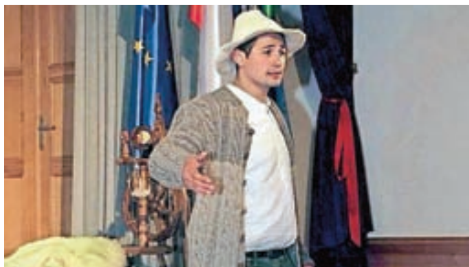
Pripovedovalski večer v Jenkovi kasarni