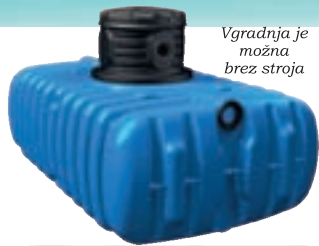
Vgradnja je možna brez stroja