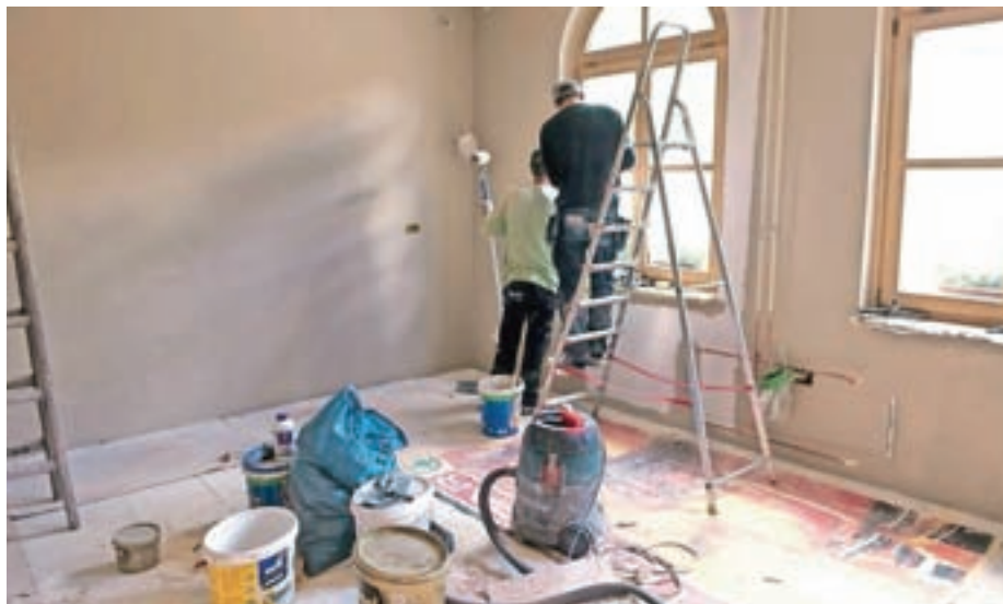
Še zadnja dela pred odprtjem lekarniške podružnice

"Danes ob praznovanju občinskega praznika odpiramo lekarniško podružnico. Žal ureditev še ne bo v celoti zaključena, zapletlo se je namreč z dobavami dolo-