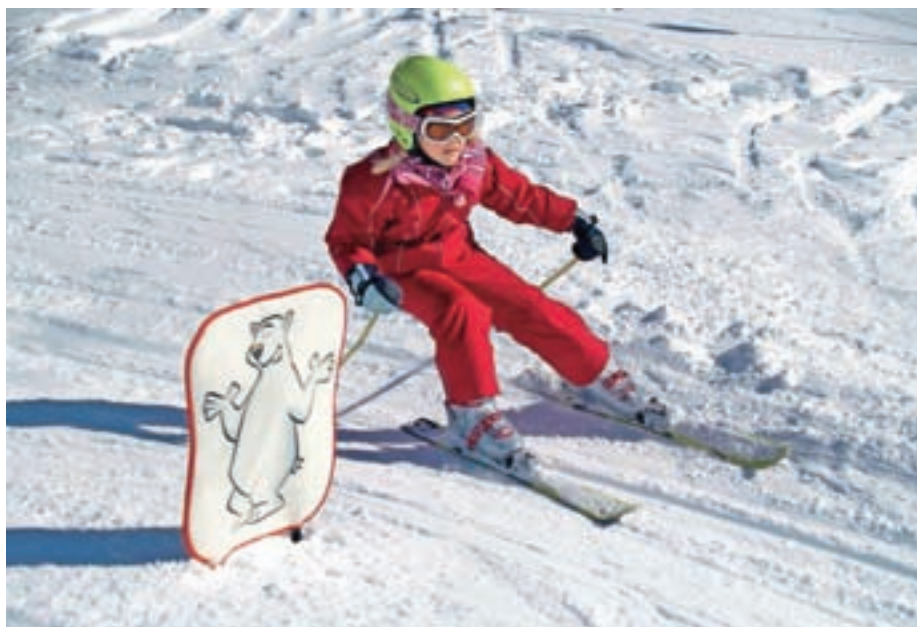
Smučali bomo doma.