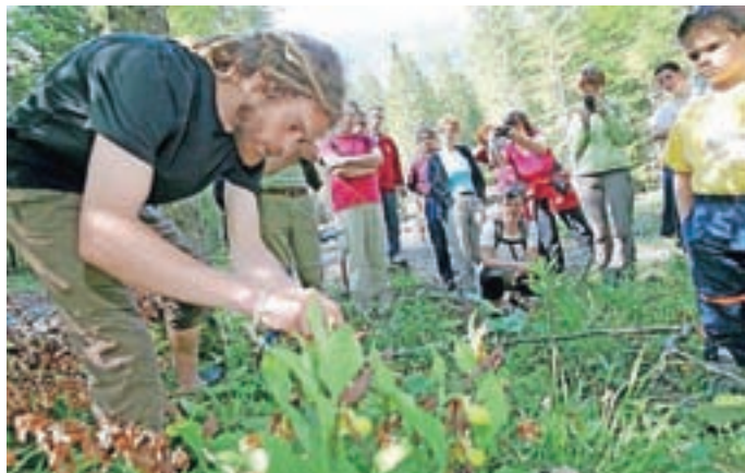
Botanični pohod po tematski poti

Tradicionalno tekmovanje mladih in starih mojstrov na harmoniki, ki se odvija tik ob Planšarskem jezeru s čudovito gor-